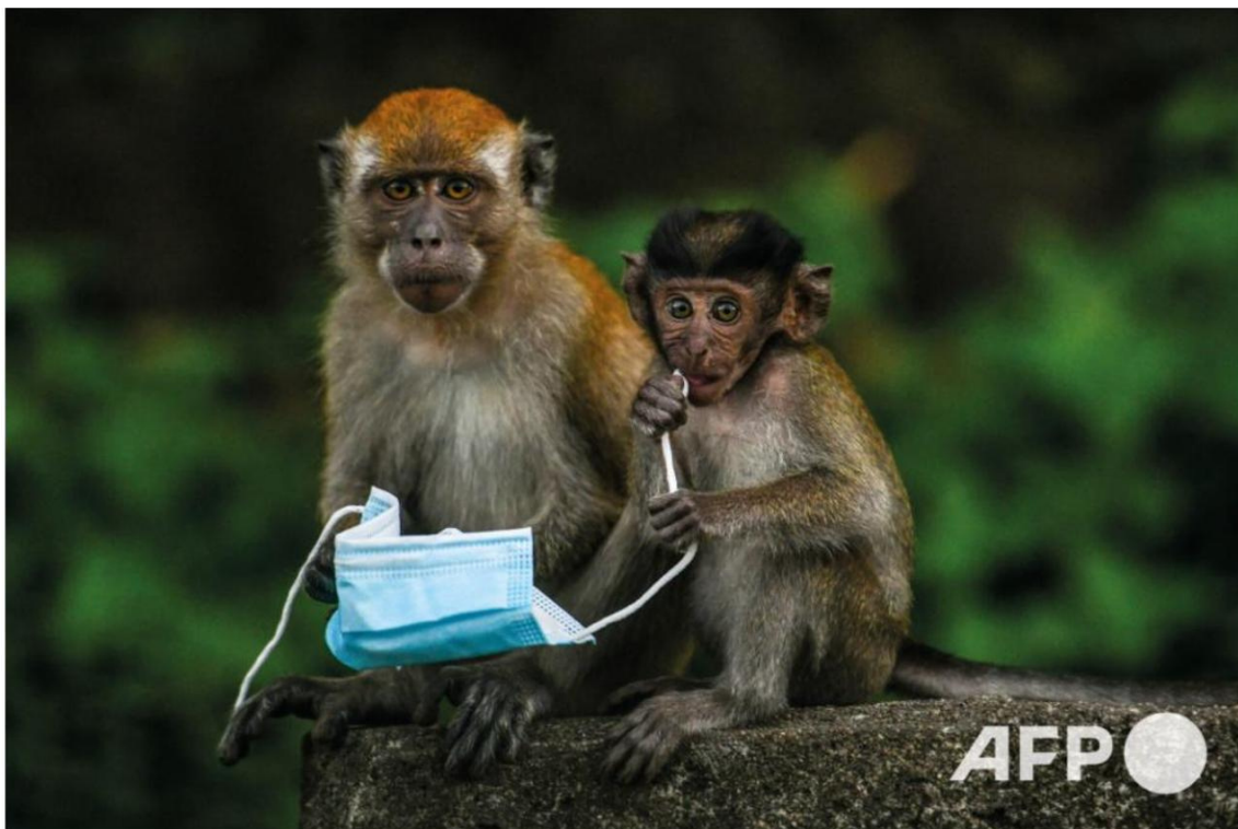
Photo lauréate 2021 – 30 octobre 2020 – Genting Sempah (Malaisie) - Des macaques jouent avec un masque facial, utilisé comme mesure préventive contre la propagation du nouveau coronavirus COVID-19, laissé par un passant à Genting Sempah, dans l'État de Pahang.

Réaction de Mohd RASFAN : « Je suis heureux que ma photo ait obtenu la majorité des votes et cela me donne l'occasion d'insister sur la nécessité de jeter son masque à la poubelle, car nous ne cessons de les multiplier et de mettre en danger les animaux dont nous devrions prendre soin. »