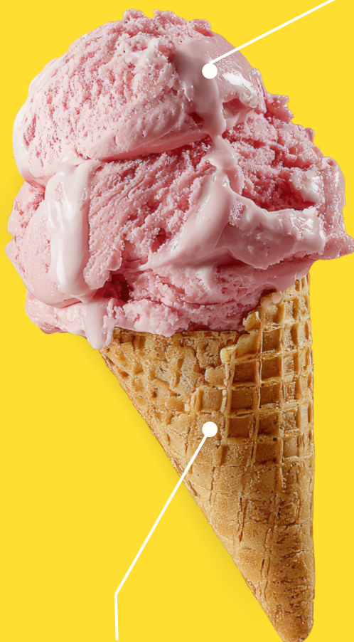
Cornet premium chocolat